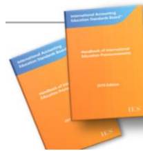
2019 Manual de pronunciamientos sobre educación internacional EDICIÓN ACTUAL

https://www.iaesb.org/publications/2019-handbook-international-education-standards